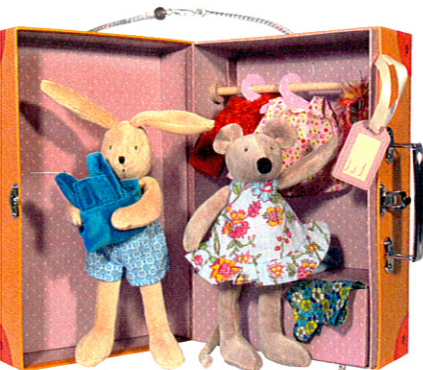
Valise «La Petite Armoire», Moulin Roty, chez Château Malices, 110 fr.