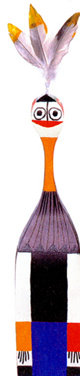
«Wooden Dolls», Alexander Girard, Vitra, chez Atmosphère, 128 fr.