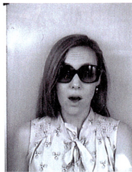
«Parce qu'en Valais il fait toujours soleil!»