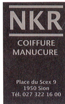
Un bon pour une pédicure O.P.I., NKR Coiffure et Manucure, 110 fr.