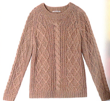
Pull Marilyn Monroe, Gérard Darel, chez Comme un Gant, 229 fr.