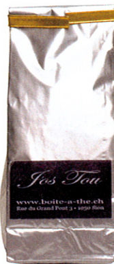
Thé Rooibos des moines, La Boîte à Thé, 10 fr.