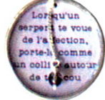
Collier long «They Said», Baies d'Erelle, chez Teinture d'Iode, 216 fr.