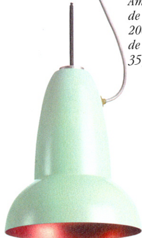
«Blossom Roccet», Hella Jongerius, Belux, chez Lumi-R, 634 fr. 85